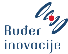
Ruder inovacije d.o.o. inovacije i transfer tehnologije